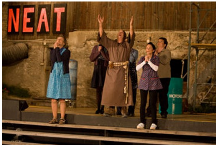
Der NEAT-Tunnel als Thema bei der Aufführung 2007.