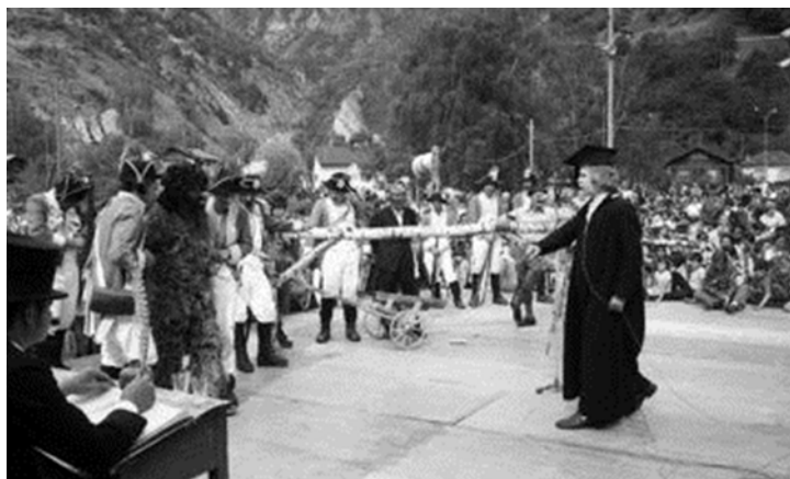
L'homme sauvage est amené devant le juge, représentation de 1971