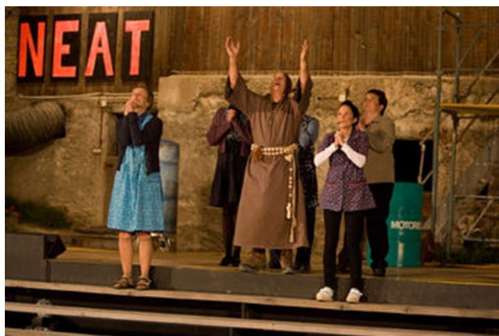
Le tunnel des NLFA dans la tourmente lors de la représentation de 2007