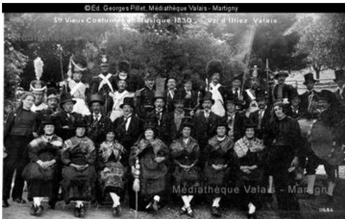
Société des Vieux costumes et musique 1830, Val d'Illicz 1924; Ed. Georges Pillet, Médiathèque Valais - Martigny.

A l'inverse des fanfares ou des chorales, les sociétés folkloriques portent non pas un uniforme mais le costume traditionnel local. Il en fut ainsi à Champéry dès la fin du XIXème siècle, lorsque l'on fonda la société